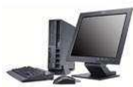
Small Form Factor (BxHxT: 317 x 355 x 99 mm)

Die ThinkCentre PC's sind je nach Modell in verschiedenen Gehäusegrößen erhältlich.