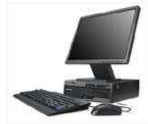
Ultra Small Form Factor (BxHxT: 276 x 270 x 89 mm)