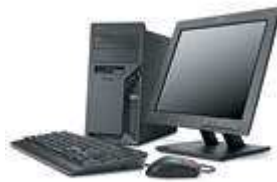
Tower (BxHxT: 175 x 440 x 402 mm)